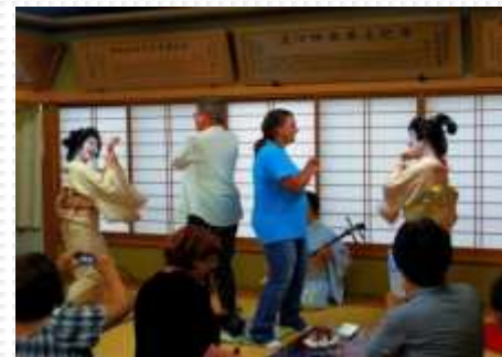
写真は26年11月時活動のもの

みたけさん 御岳山の観光振興プロジェクトとして9月より行ってきた外国人観光客へ向けた英語での情報発信の活動が、12月9日に無事終了しました。外国語での発信はこれまでになかった新しい取り組みでしたが、主催である御岳山商店組合の芸者によるパフォーマンス等に語学での協力をするにより観光客の方に大好評となりました。この活動は多くのメディアで取り上げられ、同組合からは来年度も語学協力の依頼を受けています。