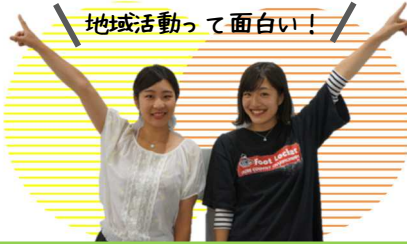
地域活動って面白い！