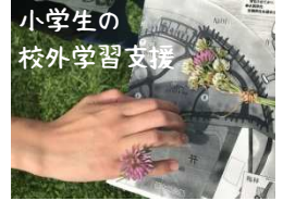
小学生の 校外学習支援