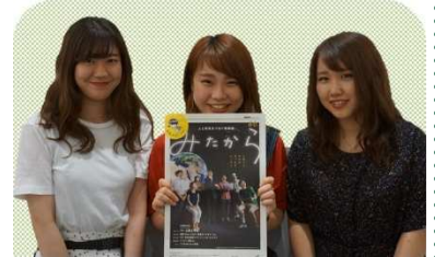
裏面記事に私たちの取材の成果が！

取材をしていく中で、イベントを主催している方々の団結力や活発さに驚き、また「イベント主催者側」ならではのお話に多くの刺激を受けました。同時に「主催する側からの視点」にたつことにより、自分が今まで何気なく参加していた地元の地域活動にも違う見え方・発見がある事に気がきました。進邦ゼミは今後も継続して「みたから」紙面の作成に参加していきます。